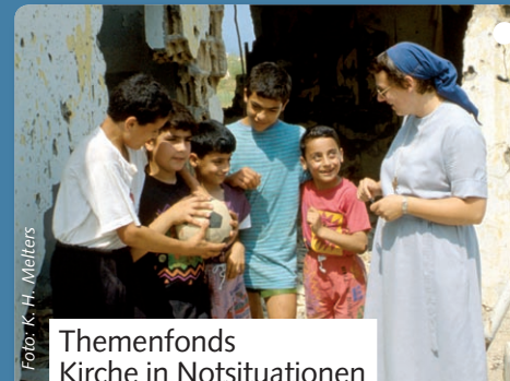
Themenfonds Kirche in Notsituationen

Fast jede dritte Frau in Syrien erfährt körperliche oder seelische Gewalt. Die „Schwestern vom Guten Hirten“ in Damaskus betreuen diese Frauen und geben ihnen Sicherheit. Dank Ihrer Hilfe konnte nun ein größeres Haus renoviert und bezogen werden, wodurch die Schwestern noch mehr Frauen eine schützende Herberge bieten können.